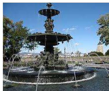
Fontaine de Tourny